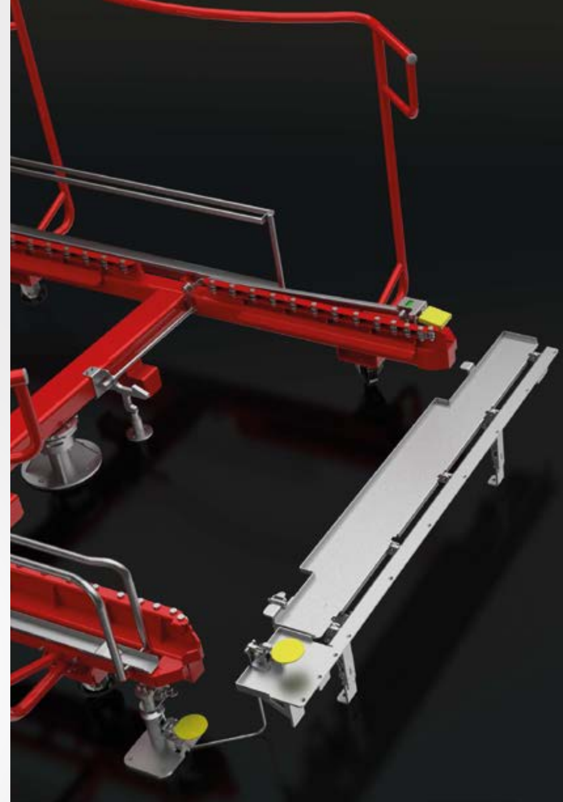
PLATE-FORME DE CONNEXION ET PÉDALE DE LIBÉRATION POUR UNE SÉCURITÉ ACCRUE CONNECTION PLATFORM AND RELEASE PEDAL

Pour assurer le niveau supérieur de sécurité, nous avons conçu un adaptateur spécial qui relie la plaque tournante au lieu de montage et élimine l'espace entre l'appareil et le poste de travail. Une pédale spéciale prévient un mouvement inattendu de la plate-forme et permet un déchargement sûr.